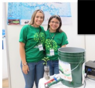
Sensor de los niveles de agua en los sistemas de almacenamiento