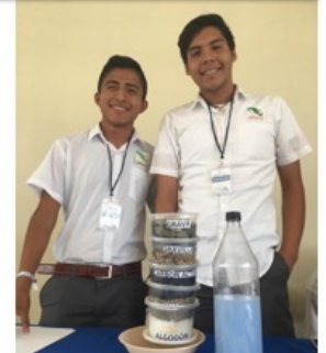
Sistema de filtros