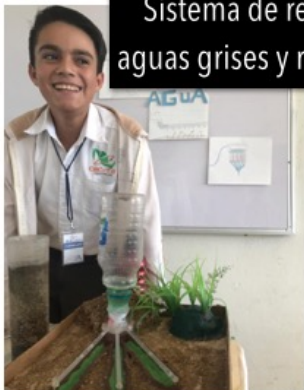
Sistema de recolecta de aguas grises y riego a goteo