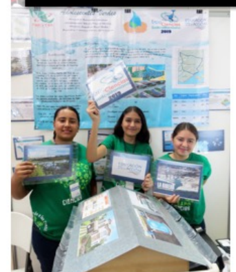
Sistema de recolecta de agua de lluvia